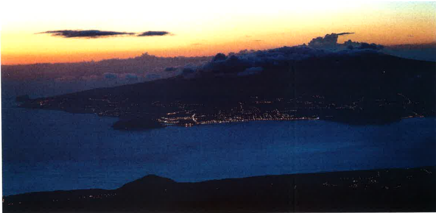
Blick in der Abenddämmerung vom Besucherzentrum des 2351 Meter hohen Pico hinüber zur Nachbarinsel Terceira