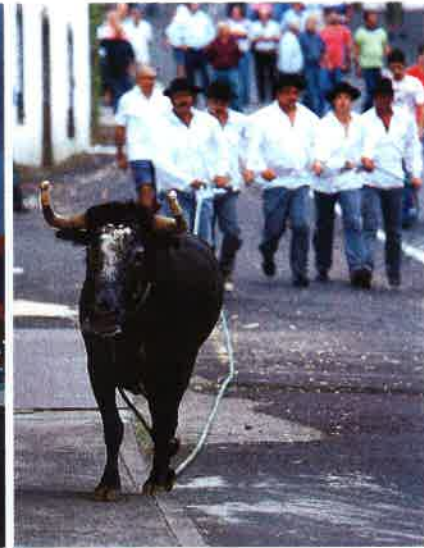
Lajes auf Pico gilt als eine der Top-Adressen für Whale-Watching-Touren. Auf Terceira werden Stiere durch die Gassen getrieben

empfiehlt noch zwei Ankerplätze, der Hafenmeister einen Besuch der Leuchttürme an den beiden Inselspitzen, eine Wanderung von Faja dos Cubres nach Faja da Caldeira, „und zum Mittag solltet ihr im Restaurant ‚O Amilcar‘ in Faja do Ouvidor einkehren“. Doch auch dort ist das Essen in erster Linie preiswert, der Thunfisch ist tiefgekühlt, das Steak eingeflogen, das Gemüse aus der Dose. „Kaum zu glauben“, meint Thomas, „bei so viel Fischreichtum und all den Rindern auf den Weiden.“