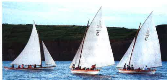
Praia da Vitória auf Terceira und ein Stück Geschichte: die alten Walfangboote