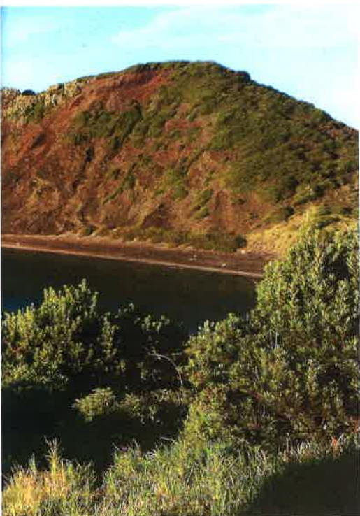
liegt, wird die Crew des Platzes verwiesen

der Rest des Atlantiks ist hier bis zu 4000 Meter tief. Die Inseln befinden sich genau dort, wo die eurasische mit der afrikanischen und nordamerikanischen Platte zusammentrifft. Und weil die sich immer noch bewegen - die Breite des Atlantiks „wächst“ jährlich um 2,5 Zentimeter -, ist die Geschichte der Inseln reich an Erdbeben und Eruptionen. Die meisten der Vulkane werden bis heute als aktiv eingestuft.