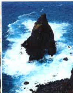
Das „Café Sport“, Kultkneipe der Segler, und der raue Westzipfel von São Jorge