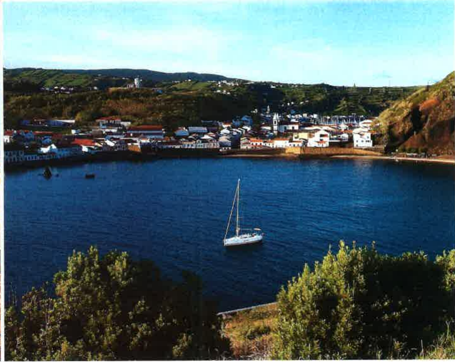
Die Altstadt von Angra do Heroísmo auf Terceira und die Bucht Porto Pim bei Horta auf Faial. Da dort ein nicht verzeichnetes Telefon!

mehr eine mehrmonatige Atlantikschleife mit dem dazugehörigen Bruch im Lebenslauf drehen.